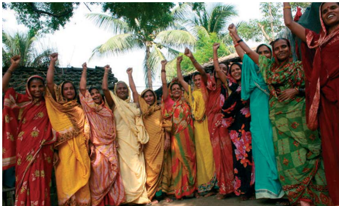
Przedstawicielki lokalnej organizacji na rzecz praw kobiet w Murshidabad, Indie.

WFC, aby zrealizować swoje cele włącza w swoje działania mężczyzn. Dla przykładu,