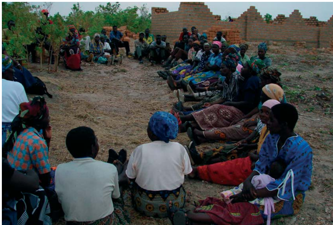
Przedstawicielki lokalnej społeczności oraz reprezentanci Women For Change rozmawiają o sukcesie, jaki jedna z miejscowych kobiet odniosła w wyborach do władz lokalnych. Madzubuka, Zambia.

po jednym z warsztatów uwrażliwiających mieszkańców na potrzeby i pozycję kobiet w społeczności chłopcy i mężczyźni z wioski w dystrykcie Lundazi we wschodniej Zambii, zdecydowali się promować równość płci przez instytucje „ mphala ”. Mphala to nieformalne wieczorne spotkania, na których męska część wioski dyskutuje o ważnych dla społeczności sprawach. Zdecydowano, że jest to najlepsze miejsce do rozważań nad kwestiami równości oraz przekazywania młodym wiedzy o konsekwencjach, jakie przynosi dyskryminacja. Udało się w ten sposób zredukować negatywne praktyki, między innymi przemoc wobec kobiet usprawiedliwianą ‘opłatą ślubną’ dla ojca panny młodej, czy ograniczanie możliwości poruszania się dla dziewcząt w wieku szkolnym.