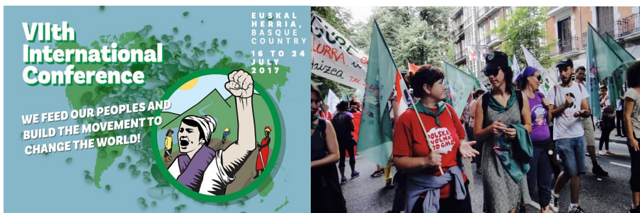
Ze światowej konferencji ruchu La Via Campesina w 2017 r.

Ponadto cały rozdział swojej deklaracji rolnicy poświęcają warunkom handlu międzynarodowego, roli międzynarodowych instytucji finansowych i międzynarodowych korporacji.