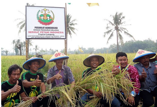
Przedstawiciele organizacji chłopskiej Serikat Petani (SPI) z Indonezji

Światowy ruch chłopski reprezentowany jest przez organizację La Via Campesina (Droga chłopska). Jednym z ważniejszych osiągnięć tego ruchu jest wypracowanie pomiędzy chłopami różnych kontynentów i rozpoznanie koncepcji suwerenności żywnościowej. W 1996 roku La Via Campesina wprowadziła założenia suwerenności żywnościowej do tematów obecnych na wysokich szczeblach decyzyjnych podczas Światowego Szczytu Żywnościowego Organizacji Narodów Zjednoczonych do spraw Wyżywienia i Rolnictwa (FAO).