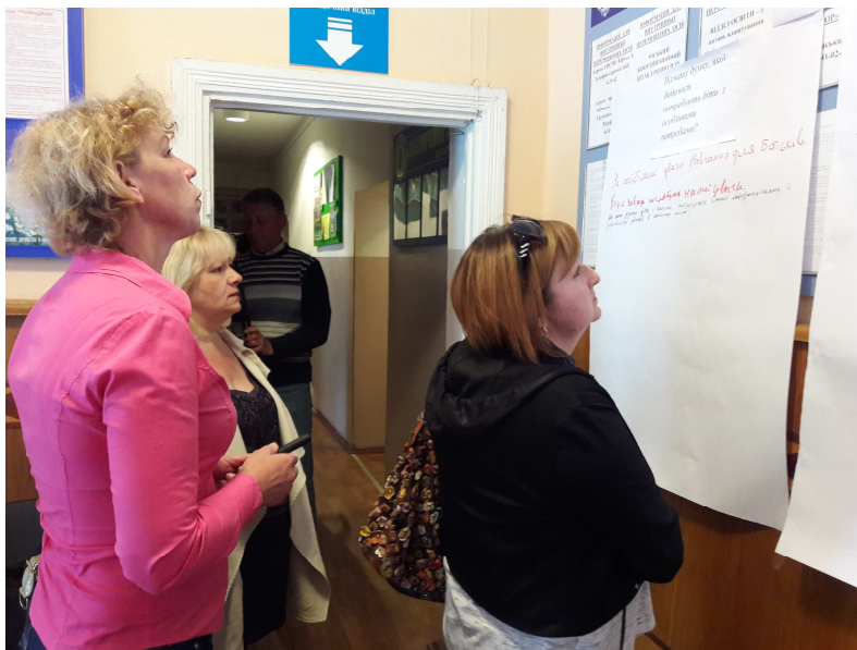
Diagnoza lokalna w Korosteniu, obwód żytomierski. Zbieranie odpowiedzi wśród mieszkańców w Wydziale Pracy i Opieki Społecznej. Zdjęcie przesłane przez uczestników projektu.

Wyniki diagnozy posłużyły grupie do opracowania projektu „Stworzenie centrum wsparcia dla rodzin wychowujących dzieci z niepełnosprawnościami”.