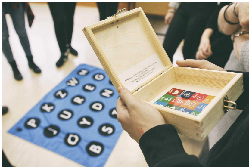
Kadr z przebiegu gry w 7 LO w Toruniu.

Dzięki zrealizowanemu z naszej dotacji projektowi udało się po raz kolejny udowodnić, że edukacja może wyjść poza ramy „suchego” przekazywania wiedzy a nauka może