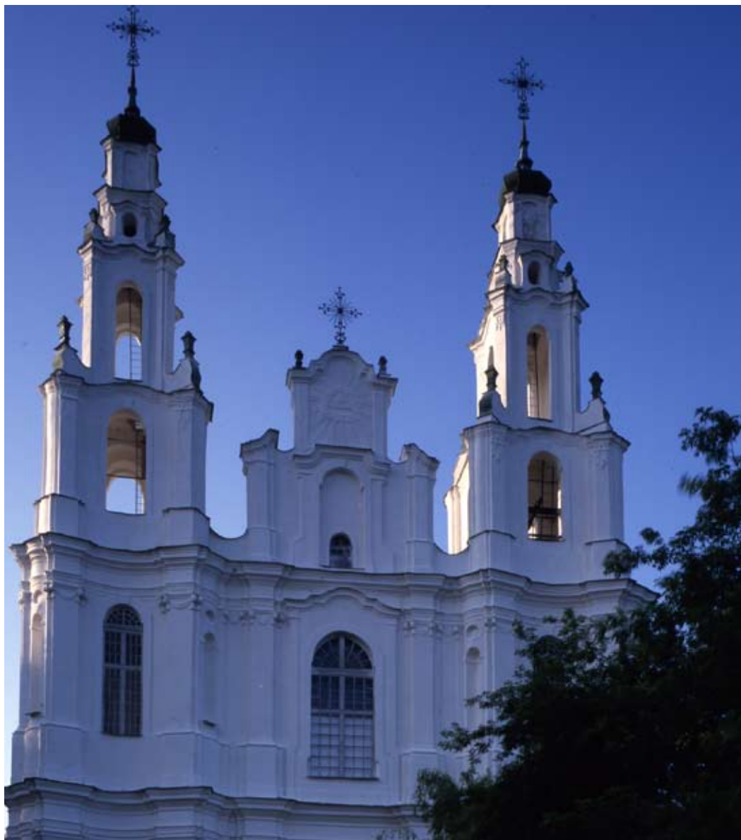
Сафійскі сабор (Божай Мудрасці)

па, а ў 1668 г. у ім размясціліся базіліяны. У 1619–1622 гг. быў адноўлены і перабудаваны (тады разабралі купал) архітэктарам Кромерам па ініцыятыве арцыбіскупа Іясафата Кунцэвіча, а хутка пасля яго пакутніцтва у ім быў змешчаны срэбны саркафаг з цэлам Св. Іясафата. У 1710 г. быў зруйнаваны па прычыне выбуху пораху, які там захоў-