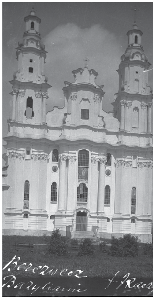
Петрапаўлаўская царква базыльян

Высокі хвалісты фасад з дзвюма вежамі, скампанаваны па ўвагнута-выпуклай лініі, мудрагелістыя формы вяршынь вежавых шчытоў, мастацкая форма ваконных праёмаў і профіляў, а таксама афармленне і барэльефы высокага класа стваралі шэдэўр еўрапейскай архітэктуры XVIII ст. Экспрэсіўная архітэктура Беразвечча паўплывала на шматлікія познебараковыя храмы Вялікага княства Літоўскага.