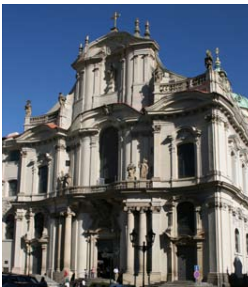
Касцёл езуітаў, Мала Страна, Прага

Мастацтва Бараміні і Гварыні знайшло вядомых паслядоўнікаў у Аўстрыі. Да іх належаў Іаган Міхаэль Прунэр (1669–1739), аўтар паломніцкага храма ў Штадль-Паўра (1714–1724). Сярод выдатных прыкладаў