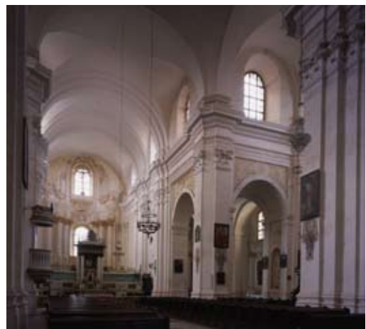
Касцёл бернардзінцаў Унебаўзяцця Найсвяцейшай Панны Марыі – галоўны неф

Касцёл пабудаваны ў плане лацінскага крыжа, мае доўгі прамавугольны прэсбітэрыі і шырокі (50 м), незвычайна манументальны, двухзруўневы фасад, які ўпрыгожаны калонамі і вежамі па баках. З’яўляецца адным з найбуйнейшых храмаў, пабудаваных на землях Рэчы Паспалітай у XVIII ст. Крыжовая прастора акцэнтавана авальным сляпым купалам, схаваным у канструкцыі даху. Форма фасада падобна да нерэалізаванага праекта ў Рыме касцёла San Carlo al Corso (1613, Анорыя і Марціна Лонгі), выкарыстанага раней Юзафам Фантанай у базільянскім кафедральным храме ў Віцебску.