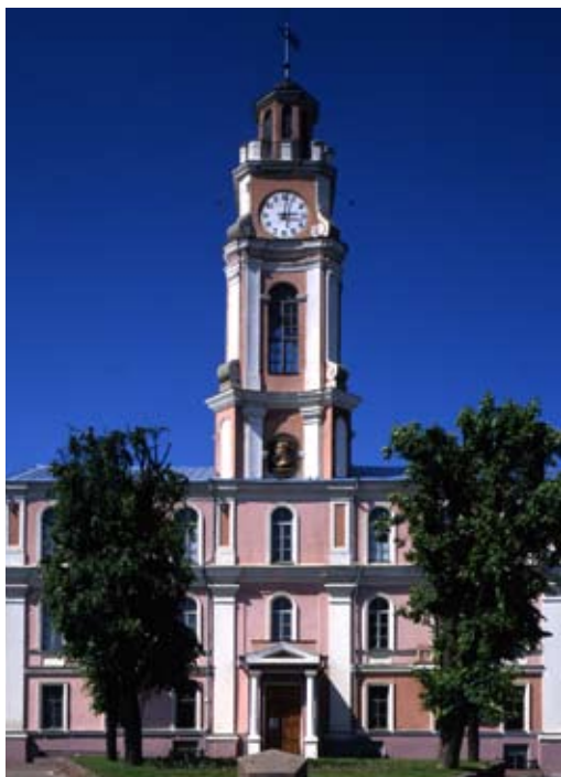
Уніяцкая Уваскрасенская царква

узарвана (захаваўся фундамент, на якім пасля выраўнання зрабілі газон). У 2001–2006 гг. праведзена рэканструкцыя па праекце Ігара Роцька і Аляксандра Міхайлокова, царква была перададзена праваслаўнай епархіі.