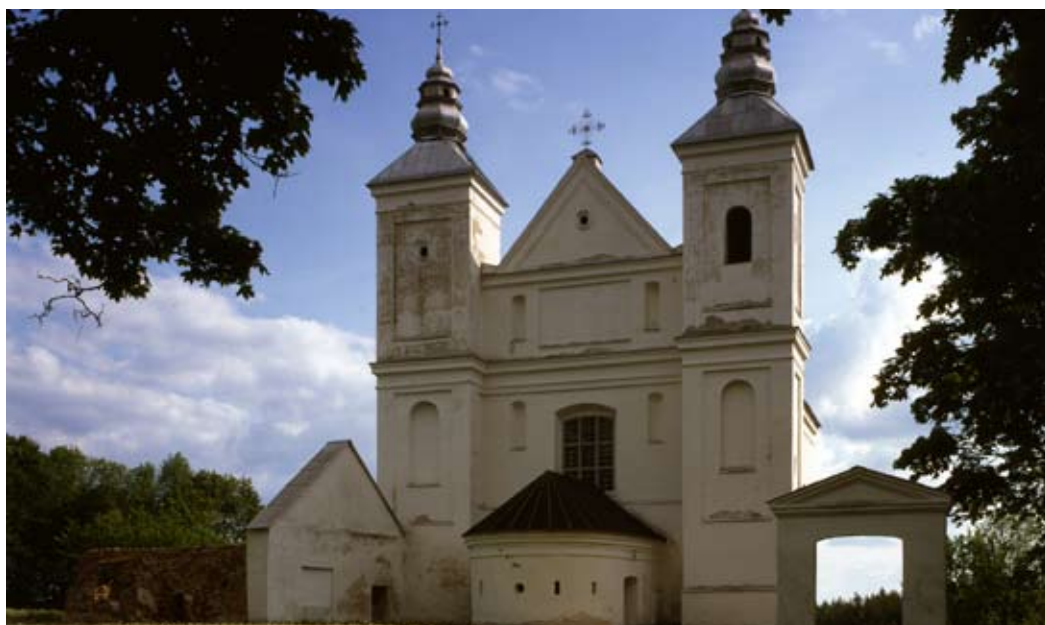
Касцёл кармелітаў Св. Тройцы і Найсвяцейшай Панны Марыі

Гэта аднанефны касцёл з кароткім прэсбітэрыем, закрытым апсідай. Пазбаўлены аздаблення кубічныя формы без арнамента і ўпарадкаваных архітэктурных элементаў імкнучца да лакальнай традыцыі (напр., творы Анджэя Кромера). Фасад з дзвюма вежамі, выступаючымі на вуглах корпуса, змяшчае наперадзе крухту ў плане падковы.