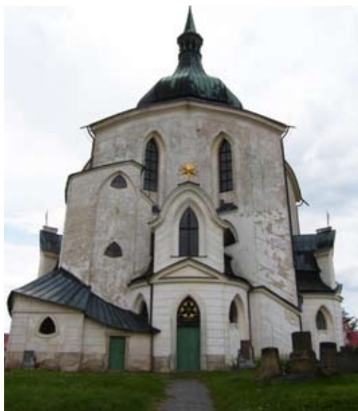
Касцёл у Ждзяры над Сазавоу

Выразныя маляўнічыя пабудовы крывалінейнай формы хутка сталі вызначаць галоўны кірунак творчасці пражскага архітэктурнага асяродка, які праз архітэктараў малодшага пакалення аздобіў усе землі Каралеўства Чэхіі. Самым цікавым з іх быў Ян Блажэй Санціні-Ахель (1677–1723), які спасылаўся