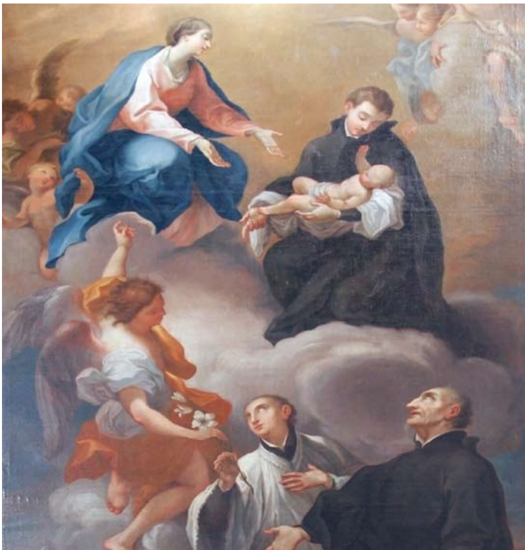
Полацк. Касцёл езуітаў Наведання Найсвяцейшай Панны Марыі і Св. Стэфана. Абраз “Пакланенне Маці Божай святых езуітаў”. Аўтар: Сымон Чэховіч (майстэрня). Цяперашняе знаходжанне абраза: касцёл Унебаўзяцця Найсвяцейшай Панны Марыі ў Аполе Любльскім (Польшча)

Прамакутная зала з пляскатым фасадам, які ўвеччаны франтонам з валютамі. Унутры пад столлю знаходзяцца тры алтары, сярод іх архітэктанічны гал. Алтар з мастацкай дэкарацыя аўтарства айца Фрэдэрыка Обста (пам. пасля 1777).