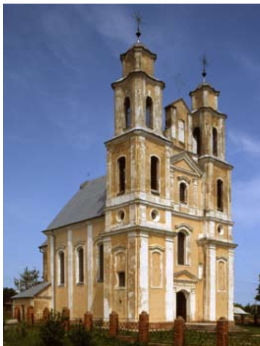
Парафіяльны касцёл Перамянення Панскага

Гэта двухвежаны касцёл, аднанефавы з ніжэйшым, часткова закрытым прэсбітэрыем. Па форме падобна да касцёла піяраў у Лужках. Высокія вежы высунутыя за межы аб'ёма корпуса, а іх два апошніх узроўні вузейшыя ў адносінах да размешчаных ніжэй. Пад хорами ляпная дэкарацыя, якая прадстаўляе музычныя інструменты.