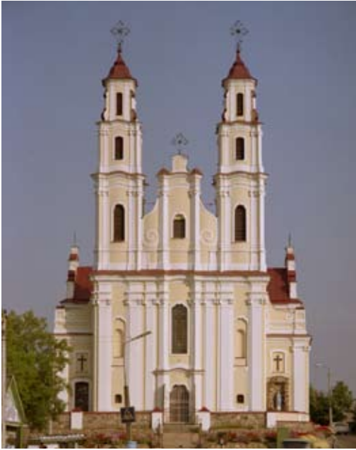
Парафіяльны касцёл Св. Троіцы

рус. Глубокое, пол. Głębokie; Віцебская вобласць