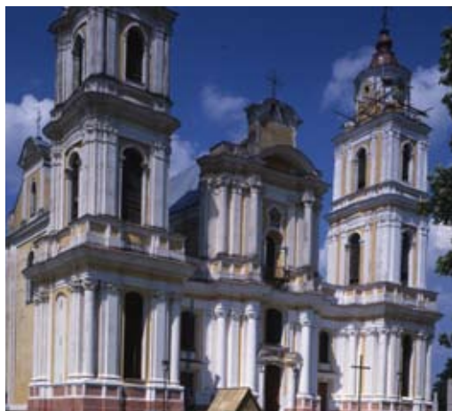
Фасад касцёл бернардзінцаў Унебаўзяцця Найсвяцейшай Панны Марыі

Гэта быў двухпавярховы мураваны будынак, у плане меў форму падковы, звязаны адным крылом з капліцай Св. Барбары. З боку плошчы меў уваход, пазначаны вежай.