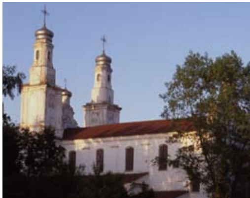
Царква базylieянаў Покрыва Прасвятой Багародзіцы

Форма двухвежавага фасада (паўн.) царквы адрозніваецца дынамічнай, ламанай лініяй выпуклых і ўвагнутых элементаў. Унутры захаваўся мураваны іканастас (да 1796 г.). Архітэктара царквы з'яўляецца дакладнай копіяй былога базylieянскага храма ў Лю-бавічах (Смаленская вобласць, Расія).