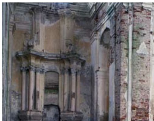
Касцёл бернардынцаў Св. Веранікі

Базіліка пабудавана ў плане крыжа, упісанага ў прамакутнік, вылучаецца кароткі прэсбітэрыў з паўкруглым верхам, упісаным у абрыс сценаў (як у касцёле езуітаў у Полацку і францішканаў у Губіне). Двухвежавы, пляскаты, добраўпарадкаваны фасад запоўнены конхавымі нішамі, якія ствараюць архаічны выгляд. Нягледзячы на разбуранні, высокі ўзровень архітэктуры паказваюць рэшткі аздабленых стукавых алтароў на канцах трансэпта.