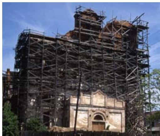
Касцёл кармелітаў Унебаўззяцця Найсвяцейшай Панны Марыі

Двухвежавая базіліка са шматкутным закрытым прэсбітэрыем і масіўным паўтараўзроўневым фасадам, падзеленым шырокімі пілястрамі з нішамі