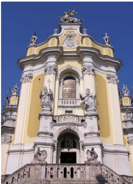
Кафедральны грэк.-кат. храм Св. Юрыя

часці Кіліана Ігнацыя Дзінцэнгофера, які мог быць яго настаўнікам.