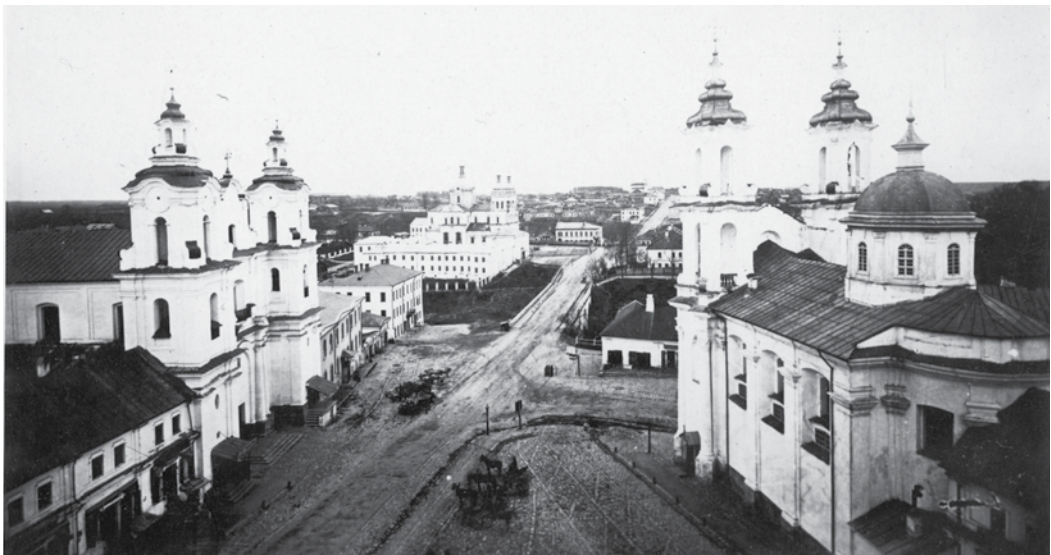
Архіўны здымак панарамы горада