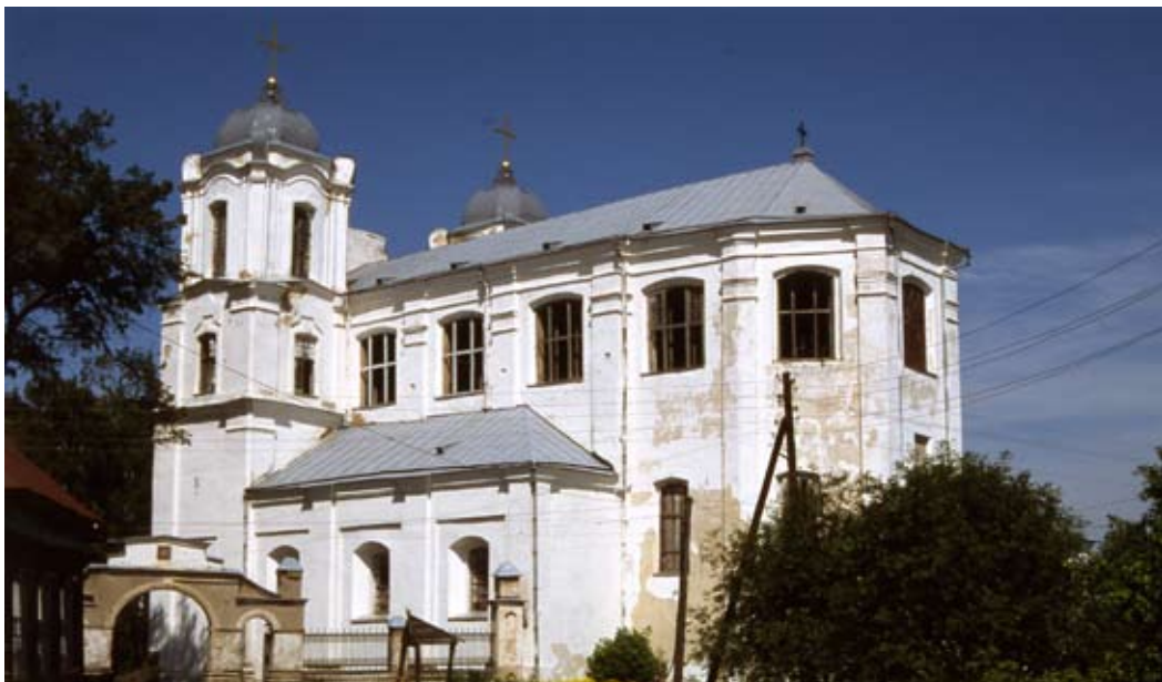
Касцёл езуітаў Св. Міхала Арханёла