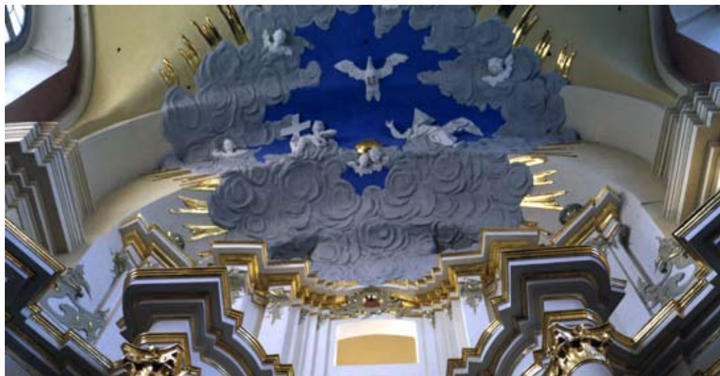
Сафійскі сабор (Божай Мудрасці). Верхняя частка галоўнага алтара

Калегіум займаў зах. частку рынка, расцягнуўшыся ўглыб Замкавага ўзвышша. Гэта была трохузроўневая пабудова вакол дзядзінца за прэсбітэрыем.