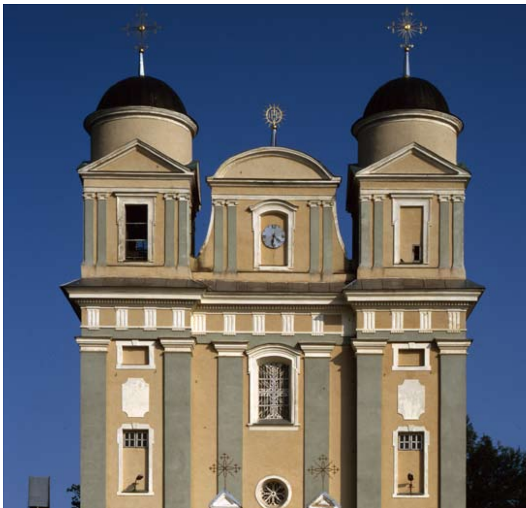
Касцёлезуітаў Св. Тадэвуша, Св. Ігнацы і Св. Францішка Ксаверыя

Гэта касцёл з трансептам, сляпым купалам і часткова закрытым прэсбітэрыем. Пляскаты двухвежавы цэтральны і бакавыя фасады абягае трыгліфавы фрыз. Інтэр'ер аздабляюць пяць алтараў і аптычная мастацкая дэкарацыя (маст. Казімір Анташэўскі, пасля 1786), якія прафінансавалі Тадэуш і Ганна Ваньковічы. Партрэты фундатараў касцёла былі перанесены з Лучая ў Віцебск.