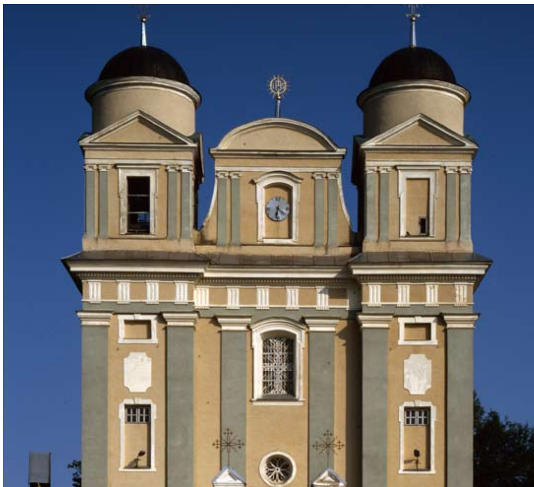
Костёл иезуитов Св. Тадеуша, Св. Игнация и Св. Франциска Ксаверия

Это костёл с трансептом, слепым куполом и частично закрытым пресвитером. Плоский двухбашенный центральный и боковые фасады охватывает триглифовый фриз. Интерьер украшен пятью алтарями и оптической художественной декорацией (худ. Казимир Антошевский, после 1786), сфинансированной Тадеушем и Анной Ваньковичами. Портреты основателей костёла были перевезены из Лучая в музей в Витебске.