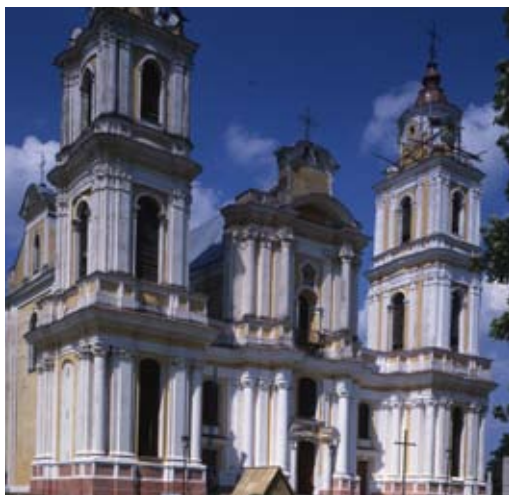
Фасад костёла бернардинцев Успения Пресвятой Девы Марии