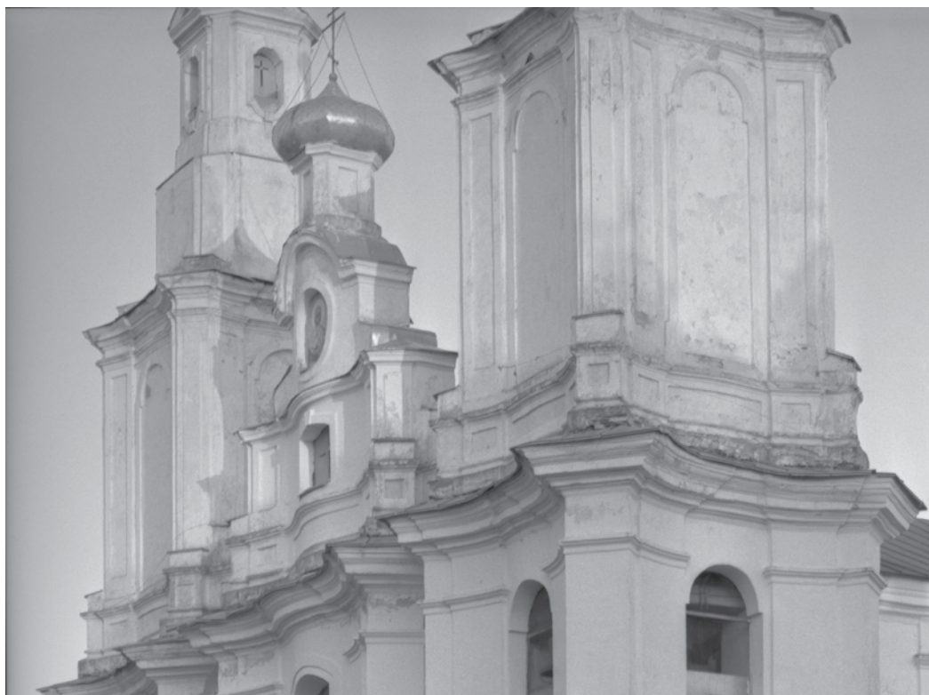
Церковь базилианов Покрова Пресвятой Богородицы