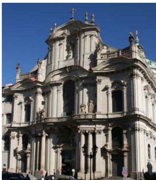
Костёл иезуитов, Мала Страна, Прага

последователей в Пьемонте. К ним относятся Филиппо Ювара (1678–1736), автор охотничьего дворца в Ступинджии под Турином (1729–1733) – монументальной постройки с большим залом в форме скрещенных эллипсов, а также Бенедетто Виттоне (1705–1770), автор многих величественных построек с централизованными вогнуто-выпуклыми стенами, такими как костёл Santa Chiara в Бра (1742–1748). Однако, проекты гениально-теотина влияли значительно шире благодаря разработанному им трактату по архитектуре, гравюры с которого были известны во всей Европе. Одна из гравюр показывает нереализованный проект костёла в Праге, вызывая особенный интерес местных архитекторов, среди которых ведущей фигурой был Кристоф Динценгофер (1655–1722). Он