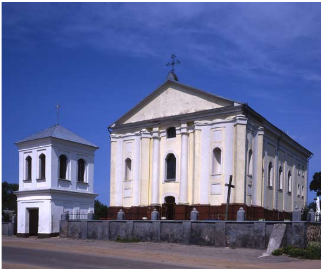
Костёл францисканцев Непорочного Зачатия Пресвятой Девы Марии

Это закрытый в прямоугольную форму, трехнефный зал с частично выступающим закрытым пресвитером. Волнистые пространства, первоначально двухбашенного фасада, разделенного пилястрами и колоннами, поставленными под наклоном. Боковые фасады разделены пилястрами.