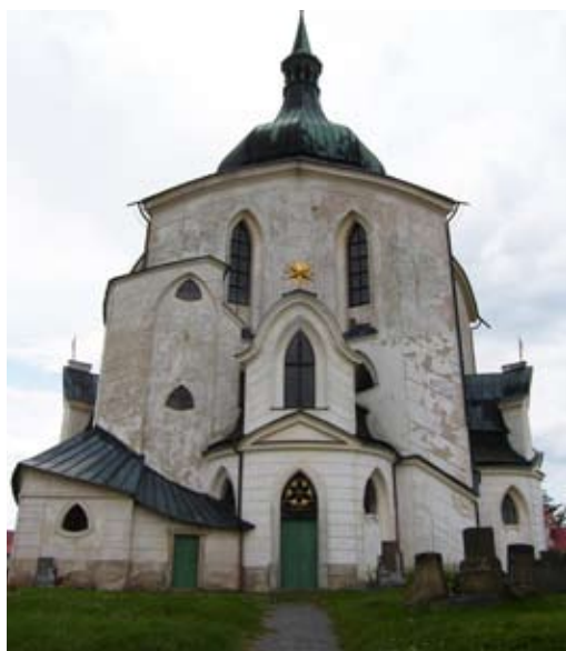
Костёл в Ждяр-над-Сазавоу

края Королевства Чехии. Самым интересным из них был Ян Блажей Сантини-Айхль (1677–1723), который ссылаясь на произведения Гварини как в постройках античной артикуляции (костёл в Кшгинах около Брно, 1718–1750), так и в наваянных средневековой архитектурой (костёл в Ждяр-над-Сазавоу, 1719–1722), демонстрируя в обоих случаях необычную фантазию и архитектурное мастерство. Самое большое количество известных зданий возвёл Килиан Игнац Динценгофер (1689–1751), сын Кшиштофа, который работал в Силезии, где проектировал костёл на Легницком Поле (1727–1731), а может быть также чрезвычайно монументальный костёл цистерцианцев в Кшешове (1728–1735). Искусство Борромини и Гварини нашло последователей и в Австрии. К ним принадлежит