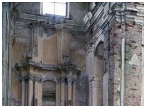
Костёл бернардинцев Св. Вероники

Базилика построена в плане креста, вписанного в прямоугольник, отличается коротким пресвитерием с полукруглым завершением, вписанным в контур стен (как в костёле иезуитов в Полоцке и францисканцев в Губино). Двухбашенный, плоский, хорошо упорядоченный фасад, заполненный конховыми нишами, создаёт архаичный вид. Несмотря на разрушения, высокий уровень показывают остатки каменных, украшенных стукком, алтарей в окончаниях трансепта.