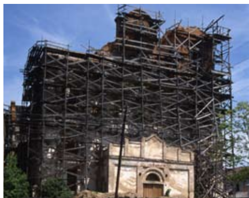
Костёл кармелитов Успения Пресвятой Девы Марии

Двухбашенная базилика с многоугольным закрытым пресвитером и с массивным полтора уровневым фасадом, разделенным широкими пилястрами с нишами.