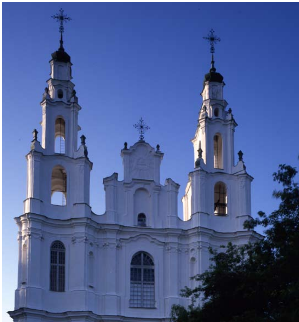
Софийский собор (Мудрости Господней)

(разобрали купол) архитектором Кромером по инициативе архиепископа Иосафата Кунцевича, а вскоре после его убийства в нём был размещён серебряный саркофаг с телом мученика. В 1710 г. был разрушен в связи с взрывом пороха. Сегодняшнюю форму (лучше вид) церковь получила в результате тщательной перестройки, проведённой в 1738–1762 гг. по инициативе полоцкого архиепископа и митрополита Флориана Гребницкого (1684–1762). В 1768–1772 гг. при соборе