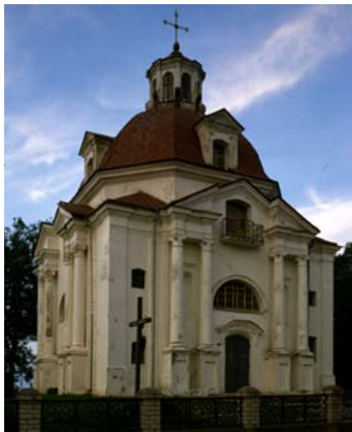
Костёл кармелитов босых Шкаплерной Божией Матери и св. Юстина

портики с парами коринфских колонн на высоких цоколях. Восьмигранный барабан купола (украшенный фреской Страшного Суда, закрашенной в 1839 г.) окружает внутренняя галерея.