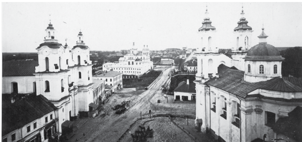
Архивная фотография панорамы города