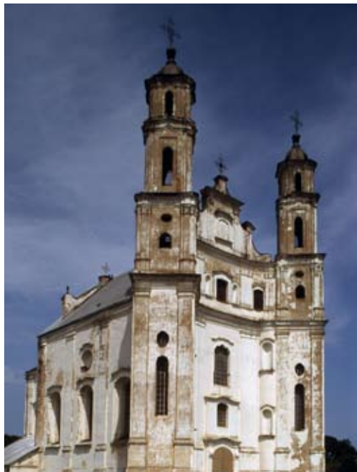
Костёл пиаристов Св. Архангела Михаила

внутри был украшен пятью деревянными алтарями. Обращают внимание разноплановые орнаментальные детали и формы надоконных карнизов и капителей.