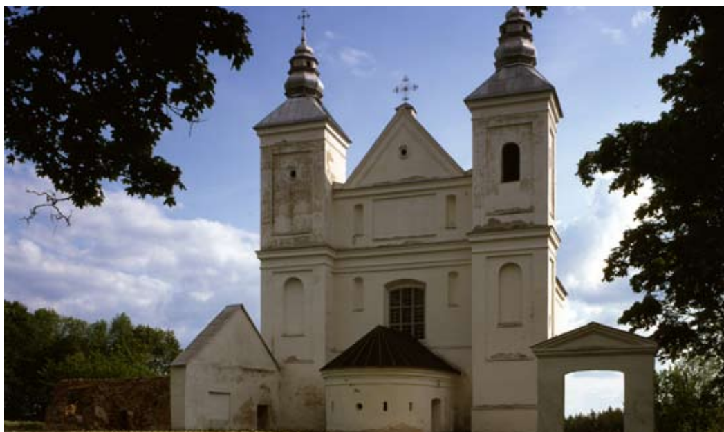
Костёл кармелитов Св. Троицы и Посещения Пресвятой Девы Марии