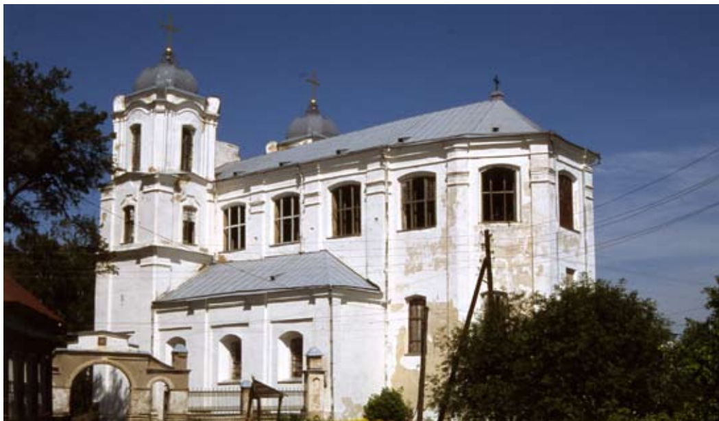
Костёл иезуитов Св. Архангела Михаила

Построен в 1730–1749 (с перерывами; с улицы так и не был закончен) под руководством Бенедикта Мёмера и Францишка Игнация Бермана (столяра). Освещён в 1752 г. Приход действовал при костёле с 1775 г. В 1832 г. был перестроен в православный Свято-Николаевский собор. В то время были разобраны башни, а крестовый пролёт увенчан деревянным куполом. С 1998 г. здание ремонтируется с назначением для музея.