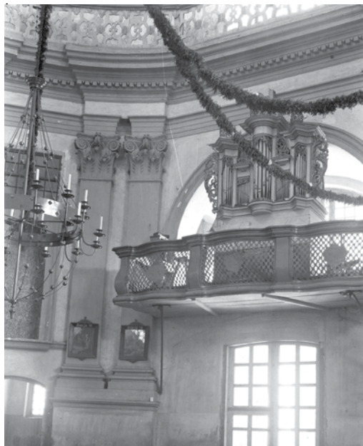
Архивная фотография хоров костёла кармелитов босых Шкаплерной Божией Матери и св. Юстина