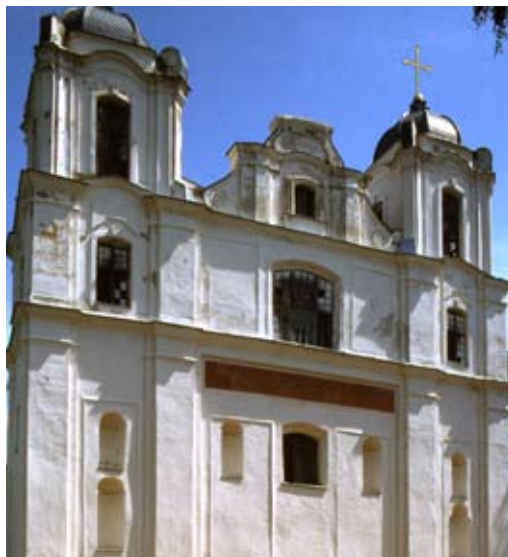
Фасад костёла иезуитов Св. Архангела Михаила