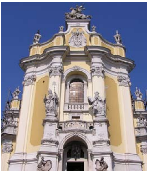
Кафедральный грек.-кат. храм св. Юрия, фото: Михал Кужэй

(ум. 1759), автор, среди прочего, львовского кафедрального грек.-кат. Храма св. Юрия (1744–1772) и костёла миссионеров в Горденке (оконч. 1760), очевидно зависимого от творчества Килиана Игнаци Динценхофера, который мог быть его учителем.