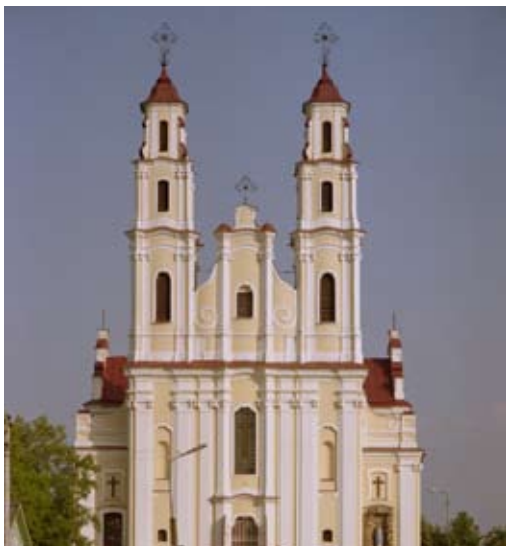
Приходской костёл Св. Троицы

бел. Глыбокае, пол. Głbokie; Витебская область