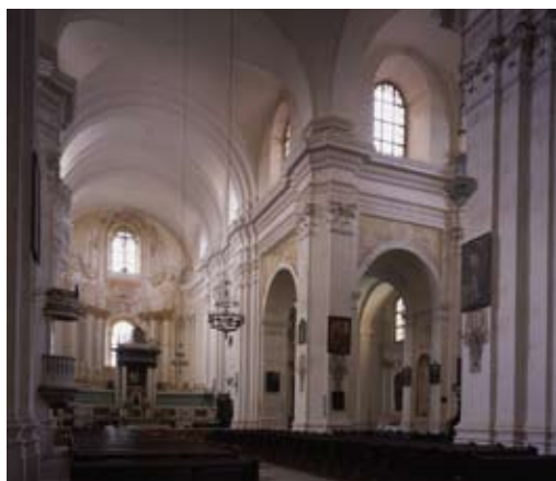
Костёл бернардинцев Успения Пресвятой Девы Марии – главный неф

Костёл построен в виде латинского креста, имеет длинный прямоугольный пресвитер и широкий (50 м) необычно монументальный двухуровневый фасад, который украшен колонами и башнями по боках храма. Является одной из самых больших святынь на землях Речи Посполитой в XVIII в. Крестовое пространство акцентировано овальным слепым куполом, спрятанным в конструкции крыши. Форма фасада похожа на нереализованный проект в Риме костёла San Carlo al Corso (1613, Онорио и Мартино Лонги), использованного ранее Юзефом Фонтаной в базилианском кафедральном храме в Витебске.