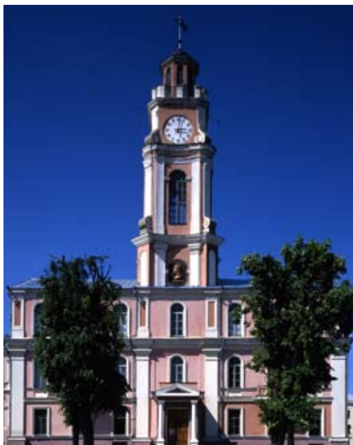
Униатская Воскресенская церковь