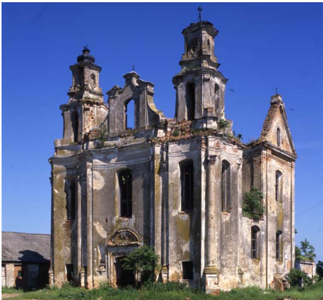
Костёл доминиканцев Успения Пресвятой Девы Марии

Фасад храма двубашенный, с тремя вогнутыми осями разделенными пилястрами, трансепт вписан в прямоугольный корпус нефа, а также пресвитерий замкнут полукругом.